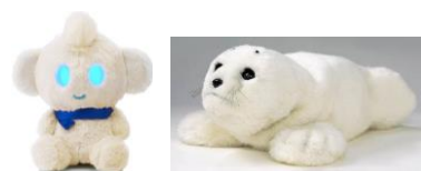
コミュニケーション