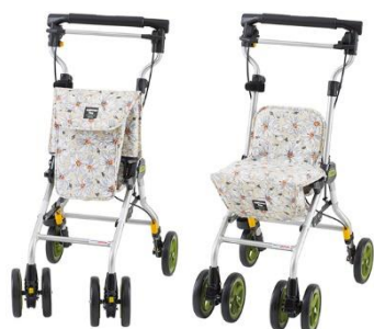
ウイズワン株式会社